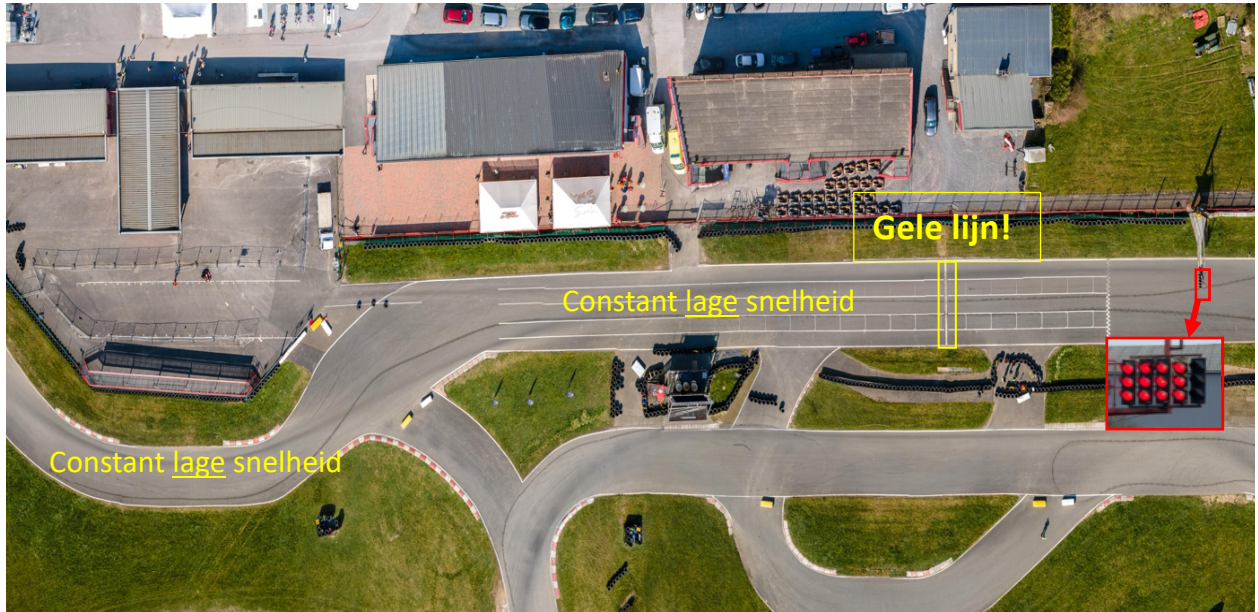
Afbeelding 3. Bovenaanzicht Mariembourg. Aandachtspunten rollende start.